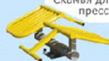
Скамья для пресса