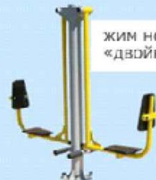
жим ногами «двойной»